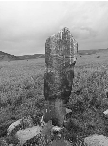
Рис 1. Древнетюркское каменное изваяние вблизи с. Ак-Тал

В урочище Кара-Даш были вскрыты неразграбленные погребения шурмакской (кокэльской) археологической культуры III-V вв. н.э. Найденные в усыпальницах могильника вещи хорошо сохранились, особый интерес представляют гробовища из плах, а также луки, сосуды из дерева, которые имеют аналогии в эпонимном памят-