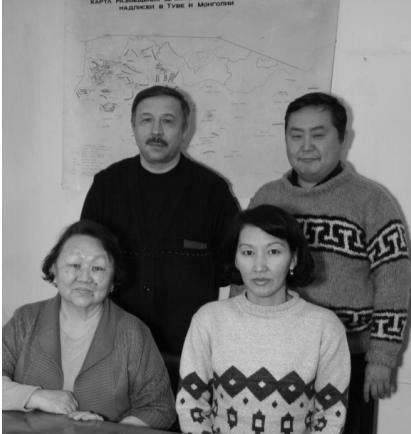
Сектор истории, 2008 г.