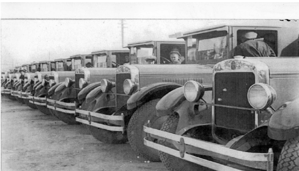
Автопарк ТНР (1930-е гг.)

Опора на частно-хозяйственную инициативу аратов и широкомасштабную советскую помощь позволили просоветскому руководству Тувы (Сат Чурмит-Тажи, Салчак Тока и др.) значительно усилить экономический потенциал республики, создать в нем крупный государственный сектор, многоотраслевую экономику, перевести ее на национальную валюту (акша).